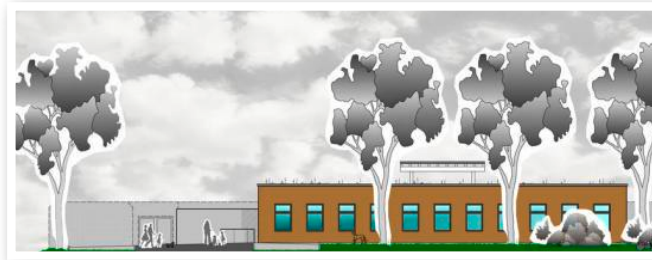
Vorderansicht des geplanten Tierheims in Plattling/Breitfeld

Wir sind Mitglied im Deutschen Tierschutzbund und im Landesverband Bayern e. V.